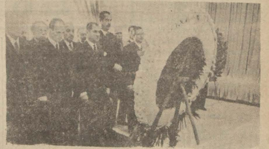
Ankara Foto munabirimizin tayyare ile yolladığı resim: Maarif Vekili ile Dil Kurumu merkez heyeti azaları Atatürkün manevi huzurunda

İzmir 26 (Hususi) — Şehrimize bağlı Bahçecik nahiyesinin Döngel köyünde müthiş bir faciye işlenmiş, genç bir anne henüz 3 yaşında bulunan yavrusunu öldürmüştür. (Devamı 5 inci sayfada)