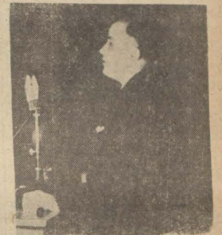
Profesör Sadi Irmak dün geceyelerinde en olgun bir devrini idrak Eminönü Halkevinde konferans verirken (Devamı sayfa 4/1 de)

Atatürk bundan 10 yıl önce mütehasıslardan müteşekkil ilk Dil Kurultayını Dolmabahçe sarayında toplamış ve tarihi direktiflerini orada vermişti. Bugün dil inkılabımız Millî Şefimiz İnönünün himayelerinde en olgun bir devrini idrak