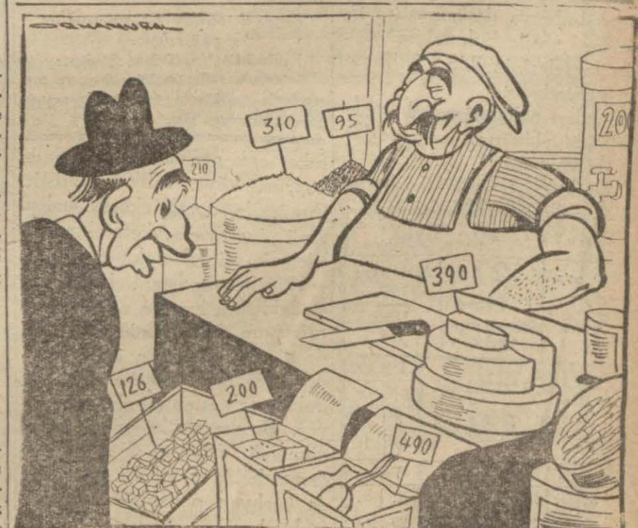
— Acaba sizde zırruk kadar insaf var mı?