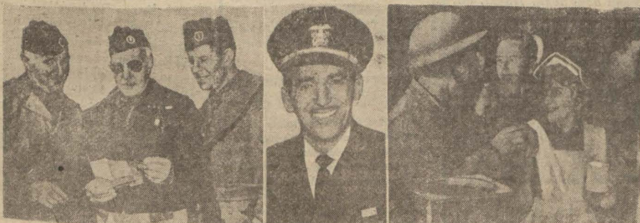
Amerikada herkesle beraber sinema yıldızları da asker oluyorlar. İşte solda birbaşı Lewis Stone bir yüzbaşı ve bir mülazimle konuşuyor, ortada Amerikan bahriyesinin yeni asteğmeni Douglas Fairbank, sağda bir asker. (Devamı 5 inci sayfada)